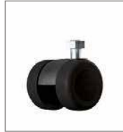
Parkettrolle (2 cm höher)