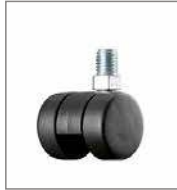
Kunststoff-Doppelrolle (2 cm höher)