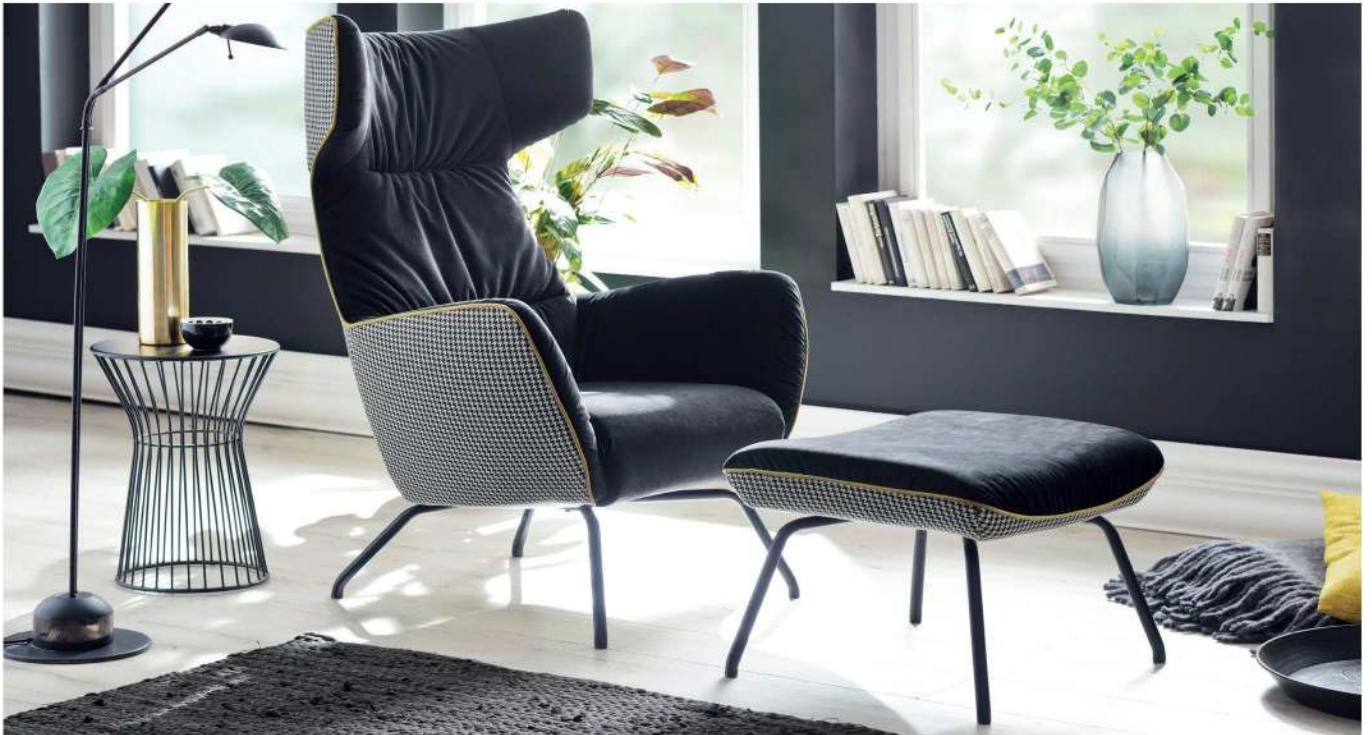
Einzelstuhl + Hocker