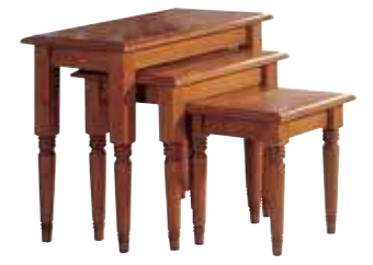
Beistelltisch groß 1437 B 72 / H 61 / T 37 cm