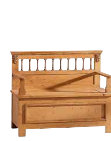
Truhenbank 1411 B 115 / H 91 / T 43 cm Abbildung: antik gewachst mit Gebrauchsspuren