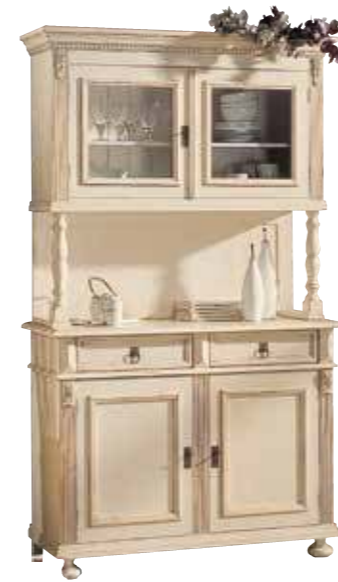
Buffetoberteil 1422 1 Einlegeboden B 117 / H 109 / T 36 cm