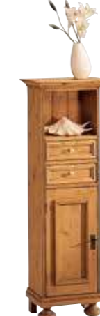
Hochkommode 1493 B 41 / H 130 / T 29 cm Abbildung: antik gewachst mit Gebrauchsspuren