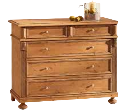
Schubkommode 1468 B 116 / H 90 / T 44 cm Abbildung: antik gewachst mit Gebrauchsspuren