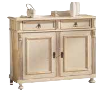
Kommode 1421 1 Einlegeboden B 116 / H 90 / T 44 cm Abbildung: weiß gewischt lackiert mit Gebrauchsspuren