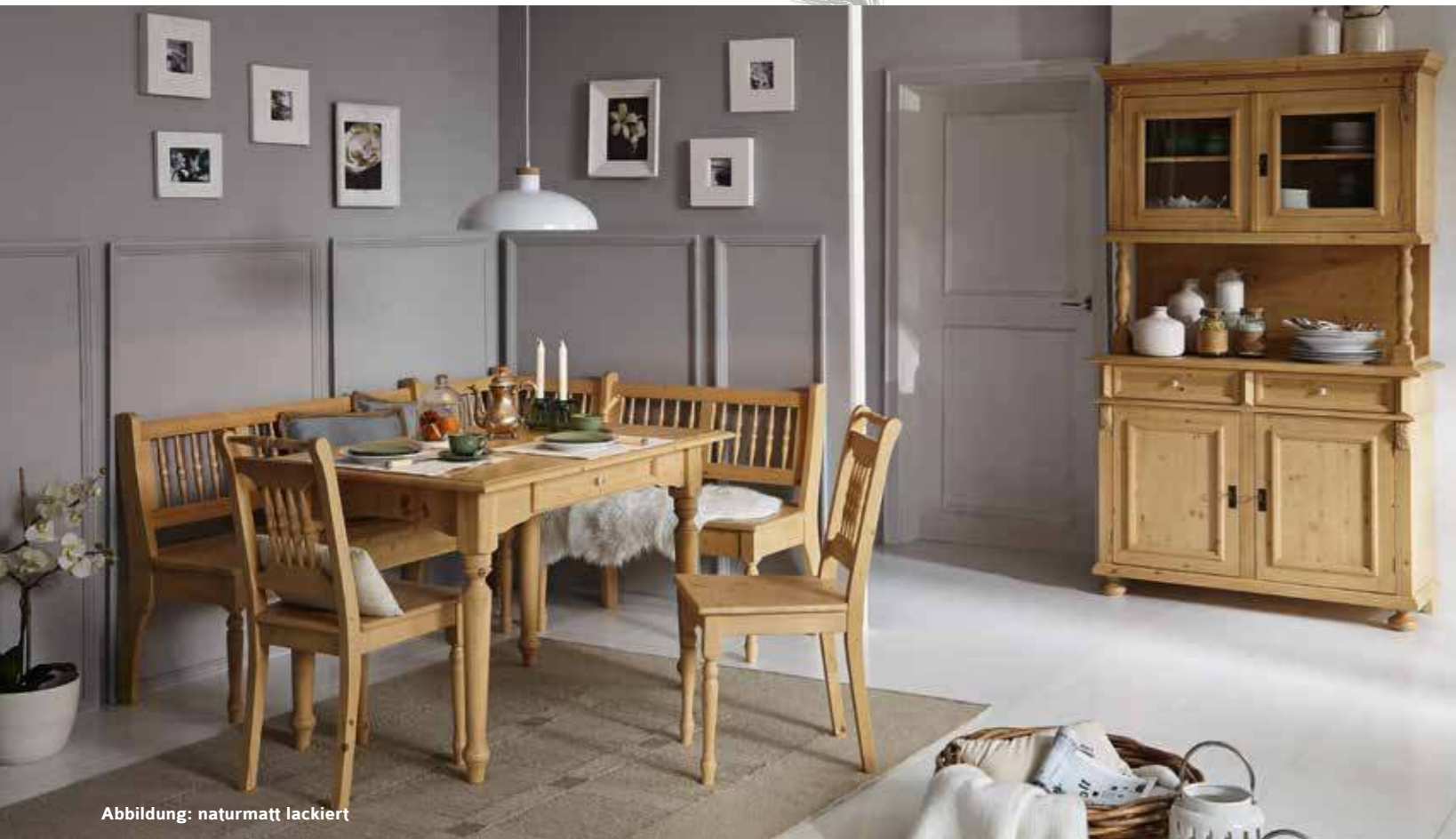
Abbildung: naturmatt lackiert