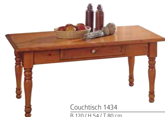
Couchtisch 1434 B 120 / H 54 / T 80 cm Abbildung: firenze lackiert