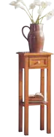
Beistelltisch 1456 B 35 / H 90 / T 30 cm Abbildung: firenze lackiert