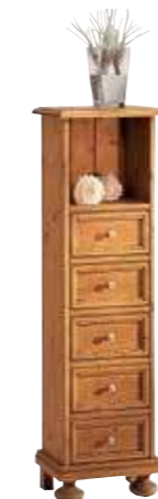
Hochkommode 1495 B 41 / H 130 / T 29 cm Abbildung: antik gewachst mit Gebrauchsspuren