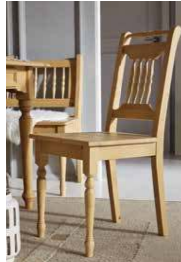
Stuhl 1431 B 43 / H 90 / T 54 cm Abbildung: naturmatt lackiert