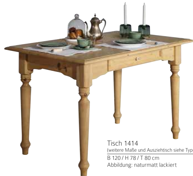
Tisch 1414 (weitere Maße und Ausziehtisch siehe Typenliste) B 120 / H 78 / T 80 cm Abbildung: naturmatt lackiert