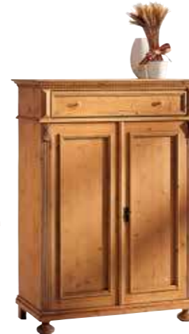
Vertiko 1465 2 Einlegeböden B 100 / H 137 / T 44 cm Abbildung: antik gewachst mit Gebrauchsspuren