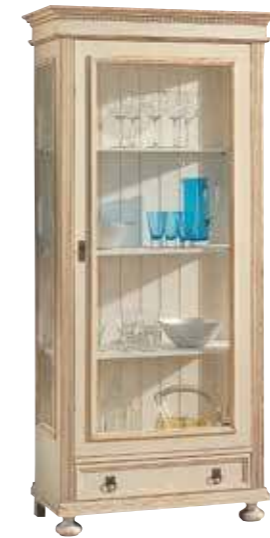
Vitrine 1461 3 Einlegeböden B 91 / H 194 / T 45 cm Abbildung: weiß gewischt lackiert mit Gebrauchsspuren