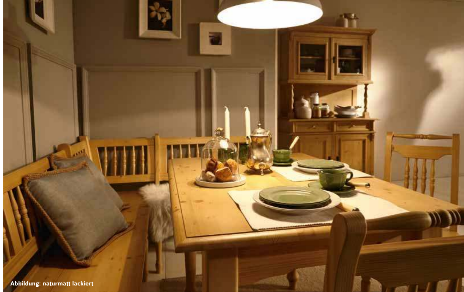
Abbildung: naturmatt lackiert