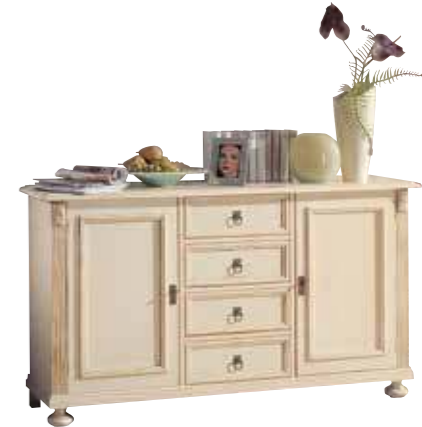
Sideboard 1423 je 1 Einlegeboden B 159 / H 90 / T 44 cm Abbildung: weiß gewischt lackiert mit Gebrauchsspuren