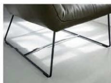
359 Drahtfuß schwarz matt