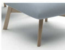
466 Holzfuß Eiche geölt