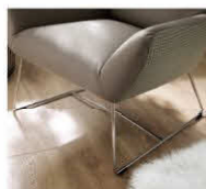
360 Drahtfuß Chrom glänzend