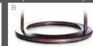
Holzdrehring in Buche (Farbe lt. Beiztonkarte)