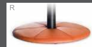
Bezogener Teller (Leder oder Stoff)