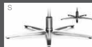
Metall-Sternfuß schmal - verchromt - Edelstahloptik - Anthrazit (pulverbeschichtet)