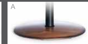
Holzteller in Buche (Farbe lt. Beiztonkarte)