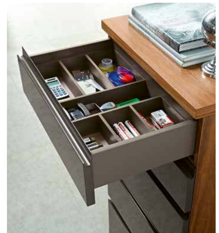
Für die Schubkasteneinteilungen stehen viele Optionen offen. There are many options for the drawer division.