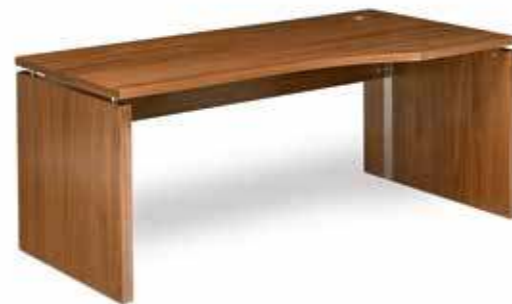
Die asymmetrisch geformte Schreibplatte erhöht die Arbeitsplatzergonomie. The asymmetrically formed writing plate increases work space ergonomics.