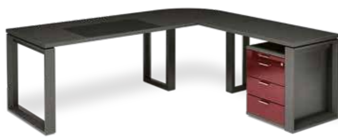
Der Klassiker über Eck mit Rollcontainer. A real classic corner solution with roller container.