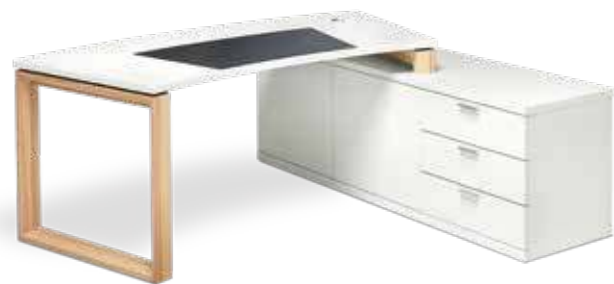
Der Clou ist hier der aufgesetzte Schreibtisch in Cockpitform auf dem Raumteiler-Sideboard. The show-stopper in this arrangement is the top-fitted desk top in cockpit shape on the partitioning side board.