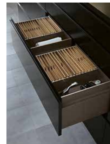
Neben der Hängeregistratur findet sich noch Platz für Ablageflächen neben den Mappen. Next to the hanging filing system, there is space for storage surfaces next to the files.

Alle Leuchten enthalten LED-Lampen, die innerhalb der Energieklasse E bis F liegen. Die LED-Lampen können nicht ausgetauscht werden. Each lamp is equipped with energy class E to F LEDs. The LEDs cannot be replaced.