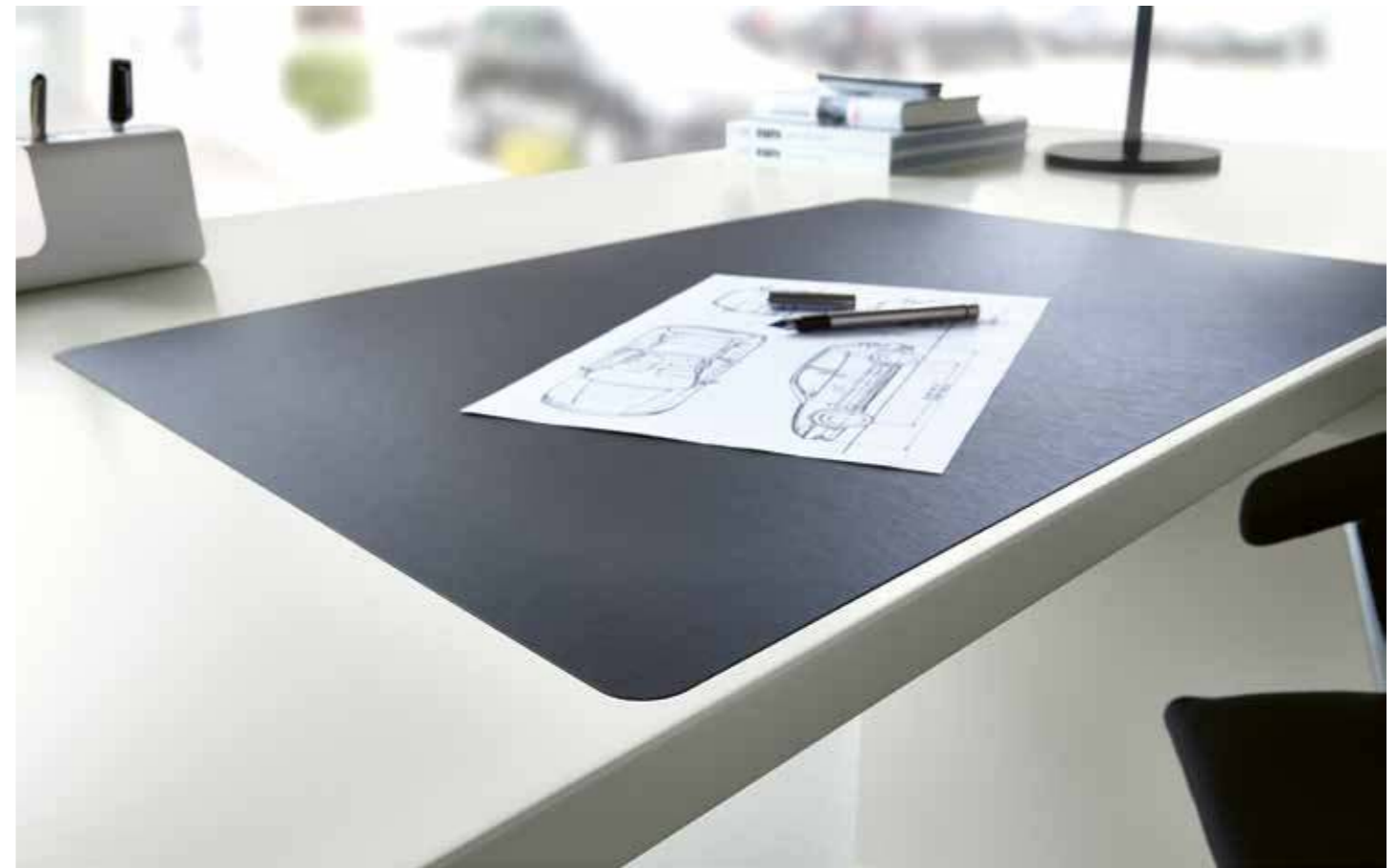
Die Linoleum-Schreibunterlage ist in die Platte eingearbeitet. The linoleum writing surface is incorporated into the plate.