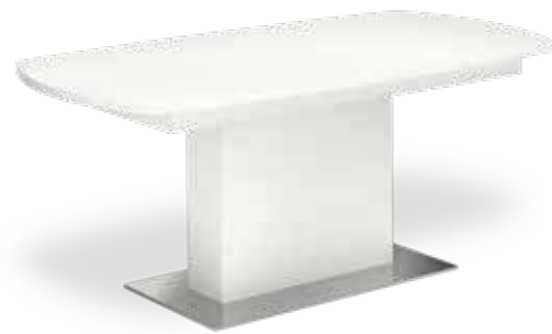
Der Säulentisch ist in 3 Größen erhältlich und eignet sich sowohl für ein kurzes Meeting als auch für intensive Konferenzen. The column base table is available in 3 sizes and is suitable for both short meetings and intense conferences.