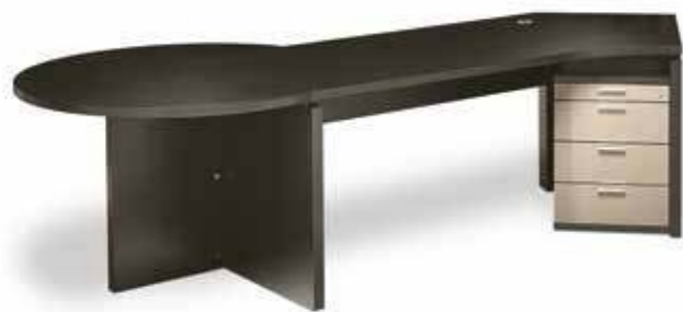
Sinnvoll und gelungen: der angedockte Besprechungsplatz. Sensible and well-executed: the attached consultation area.