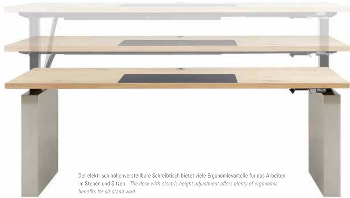
Der elektrisch höhenverstellbare Schreibtisch bietet viele Ergonomievorteile für das Arbeiten im Stehen und Sitzen. The desk with electric height adjustment offers plenty of ergonomic benefits for sit-stand work.