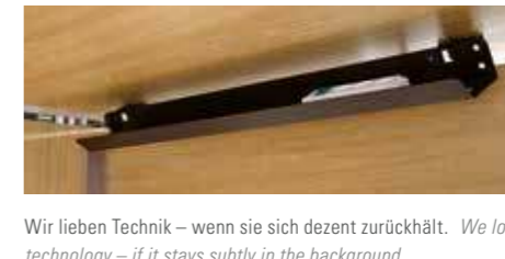
Wir lieben Technik – wenn sie sich dezent zurückhält. We love technology – if it stays subtly in the background.