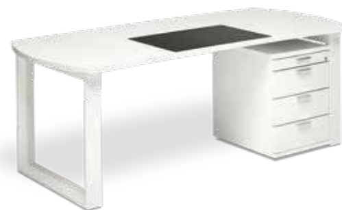
Der filigrane Einzelarbeitsplatz mit integrierter Schreibunterlage. The delicate single work space with integrated writing surface.