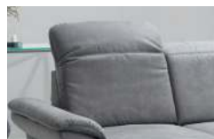
Rücken 3 inklusive Kopfteilverstellung

Jetzt ist es möglich sich für eine Rückenvariante zu entscheiden.