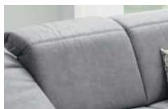
Rücken 2 nicht verstellbar