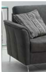
ST „A“ abklappbar optional