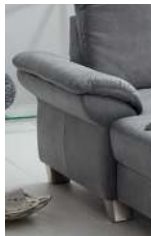
ST „B“ Kissen klappbar optional