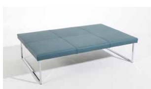
1D Couchtisch rechteckig