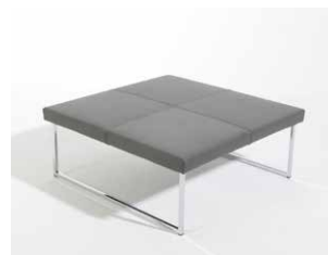
1C Couchtisch quadratisch