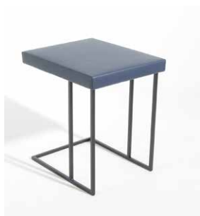
1A Laptoptisch hoch