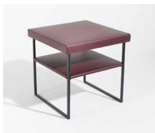
1B Beistelltisch quadratisch hoch mit Zwischenablage