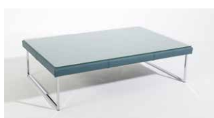
1D Couchtisch rechteckig mit Glasplatte 9D