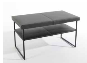
1E Beistelltisch rechteckig hoch