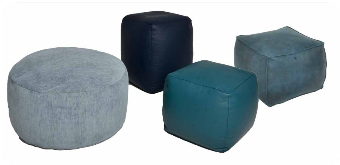
1A Bodenhocker rund - 1F Sitzhocker hoch - 1E Sitzhocker niedrig - 1G Sitzhocker mit Sattlernaht