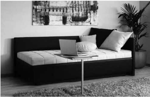
Abbildung zeigt Version Lido 4 BK DLS Preise ohne Kissen und Accessoires