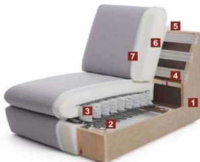
TrendLine Sitzkomfort „KOMFORT“