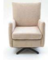
2201-11 (Drehteller oder 5-Stern- Flacheisenfuß)