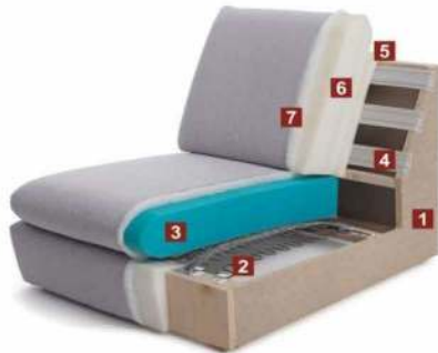
TrendLine Sitzkomfort „SOFT“