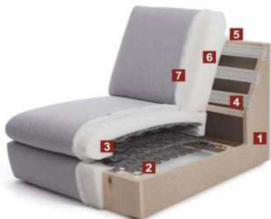
TrendLine Sitzkomfort „MEDIUM“