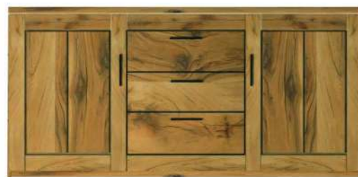
5414- / Anrichte