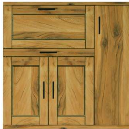
5494- / Sekretär mit Comfort-Beschlag