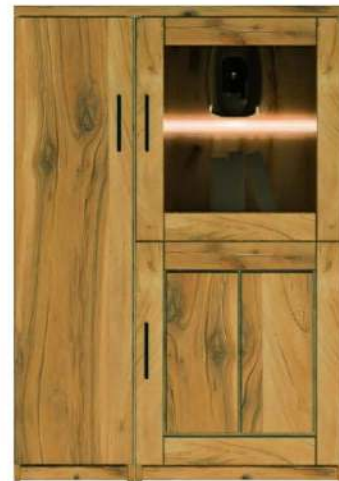
5444- / Highboard