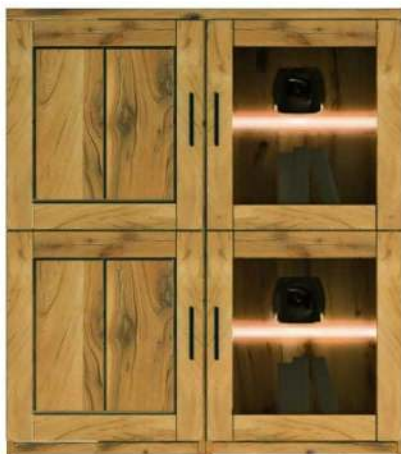
5454- / Highboard

mit komfortabler Home- Office Innenaufteilung!