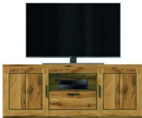
5424- / Lowboard