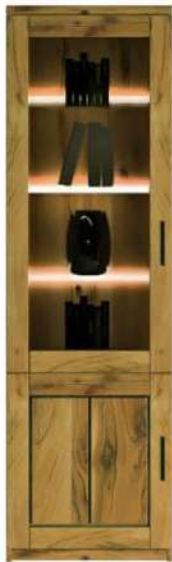
5464- / Vitrine, links angeschlagen