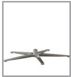
5-Sternfuß versch. Metallf.