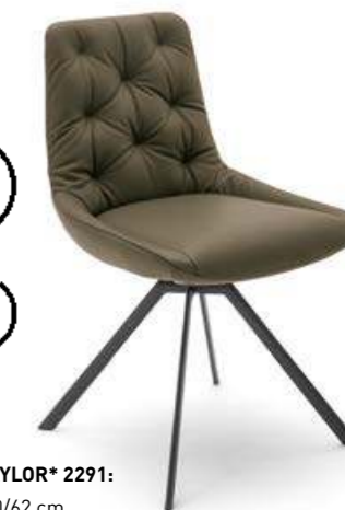
STUHL TAYLOR* 2291: BHT 53/90/62 cm