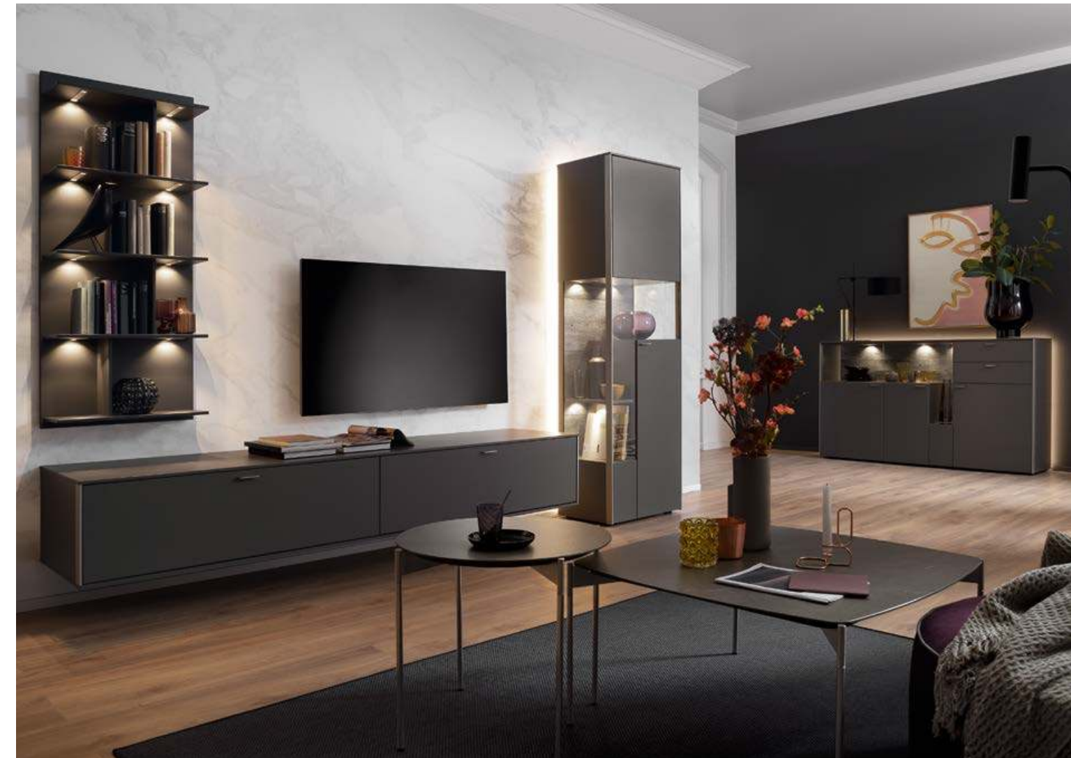
Kombination SI04-3617L: BHT 324/207/53 cm • Sideboard 5263-3617R: BHT 182/105/43 cm • Lack schiefergrau matt, Fjord Fichte grau • Aluleiste metallfarbig matt • Couchtisch RIO* 4942-1766M: LBH 83/83/42 cm • Beistelltisch RIO* 4946-1766L: LBH Ø 55/49 cm • Edelstahl optik, Keramik pazifikgrau