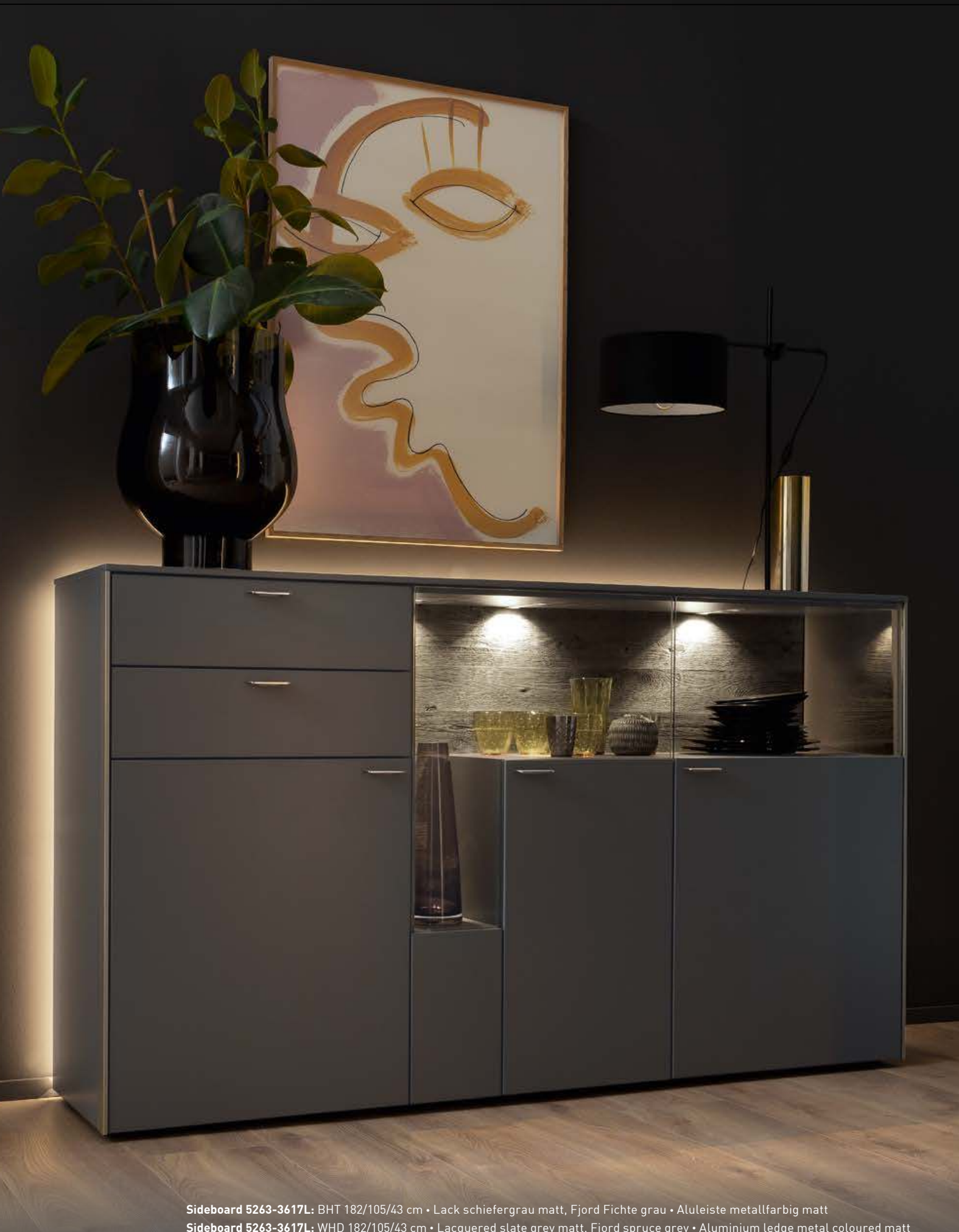
Sideboard 5263-3617L: BHT 182/105/43 cm • Lack schiefergrau matt, Fjord Fichte grau • Aluleiste metallfarbig matt Sideboard 5263-3617L: WHD 182/105/43 cm • Lacquered slate grey matt, Fjord spruce grey • Aluminium ledge metal coloured matt