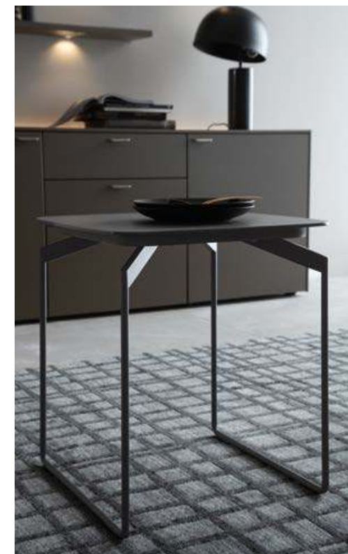
Beistelltisch CANNA* 4540-1866L: LBH 43/43/49 • Metall anthrazit matt • Keramik pazifikgrau