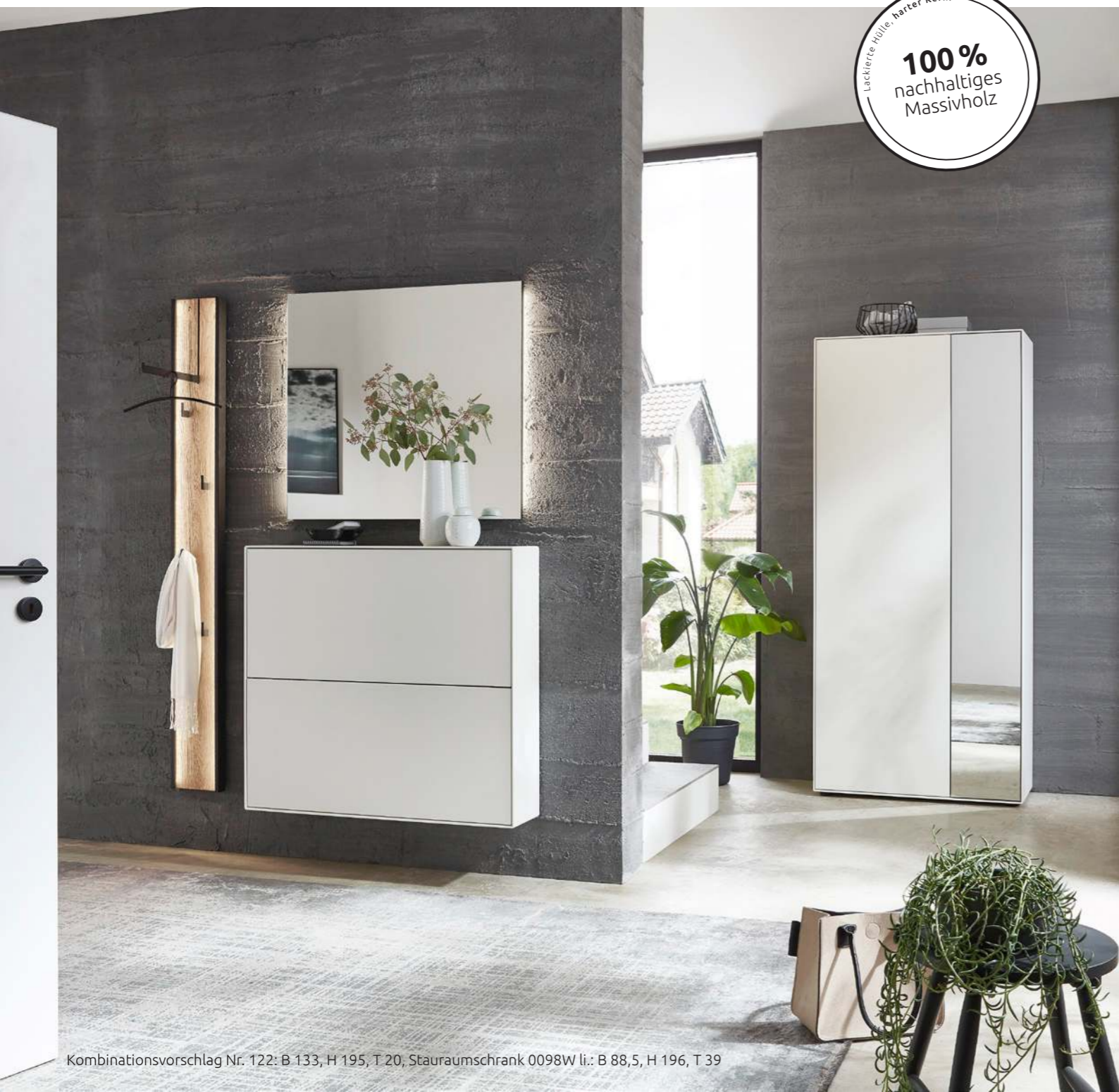
Kombinationsvorschlag Nr. 122: B 133, H 195, T 20, Stauraumschrank 0098W li.: B 88,5, H 196, T 39