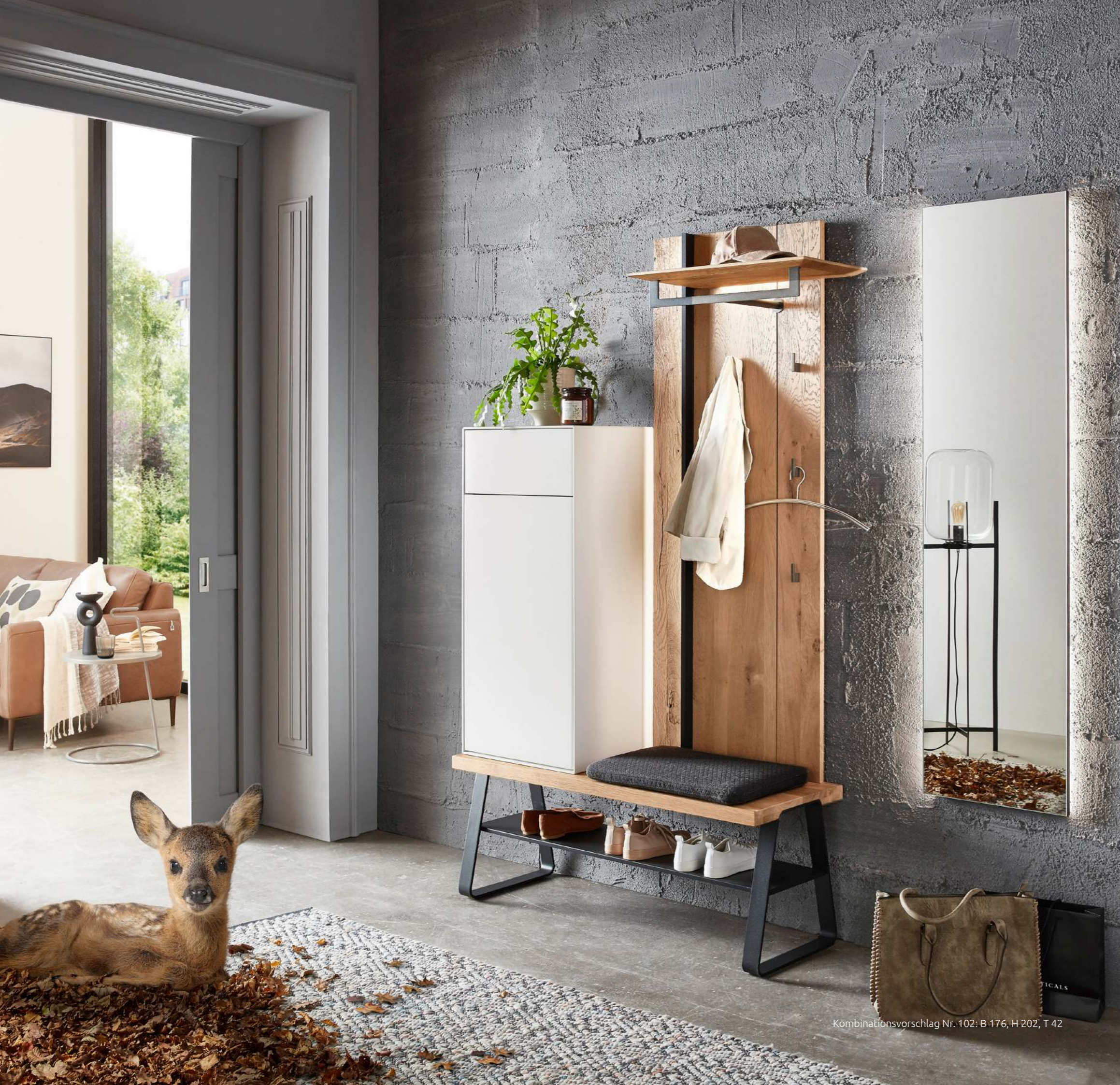
Kombinationsvorschlag Nr. 102: B 176, H 202, T 42

A practical push-to-open function lets you open the fine drawers with their solid wood frames and fine leather lining.