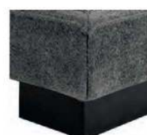
S901-13 S901-18 Sockel schwarz gegen Aufpreis