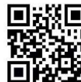
Montageanleitung Polsterbett mit Füßen