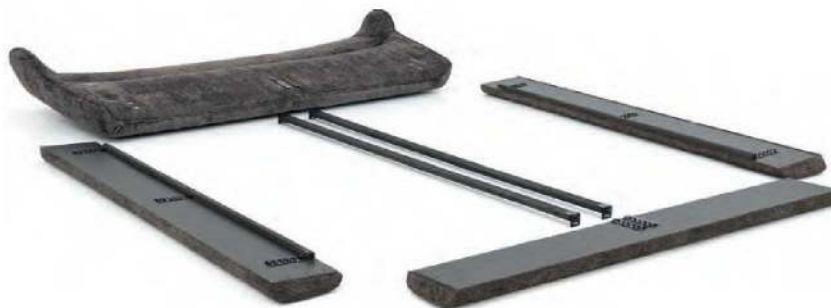
Bettgestell gepolstert • innen anthrazit • transportfreundlich zerlegt • variable Liegehöhe von ca. 7 cm durch seitliche Beschläge

Nahtoptik wird immer dem ausgewählten Kopfteil angepasst