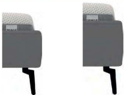
KU24 kubisch Höhe ca. 24 cm