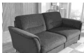
Rücken 2 inkl. Kopfstützentaschen