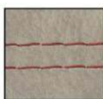
rot - F01