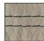
schwarz - F26