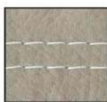
weiss - F10