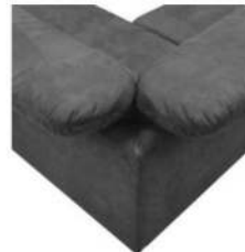
Ansicht der Eckteile mit Rücken 3 Typ -05, -41, -42