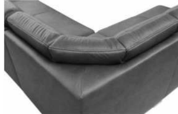
Ansicht der Eckteile mit Rücken 1 + 2 Typ -04, -804, -56, -57, -58, -59