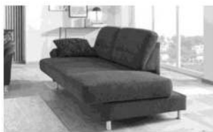
Sitzvorzug motorisch APSVZMOT