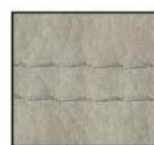
grau - F08