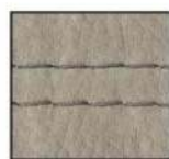
stein - F16