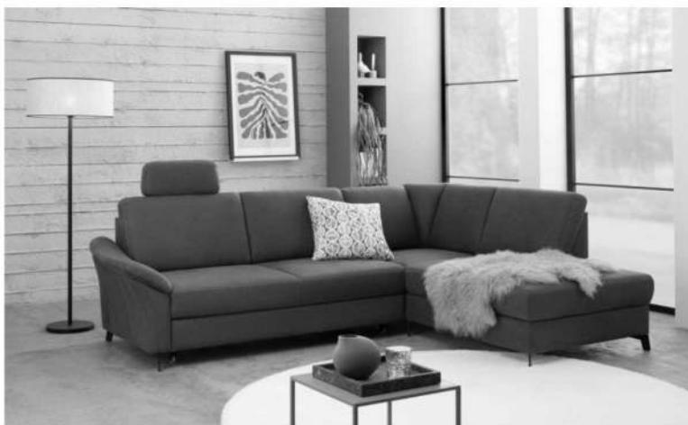
Sofa/3 sitz ST links Typ -38, Ottomane rechts Typ -59 F135 Metall schwarz(100mm) Seitenteil "G"