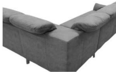
Ansicht der Eckteile mit Rücken 3 Typ -04, -804, -56, -57, -58, -59