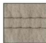
schlamm - F19