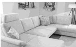
Sitzvorzug motorisch AP35SVZMOT