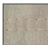
beige - F07