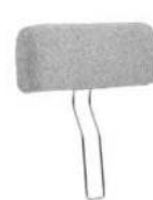
Typ -266 Kopfstütze lose Metallbügel mit Gelenk für Wallfree - Funktion Rücken 1 + Rücken 2