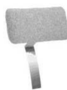
Typ -166 Kopfstütze lose Metallschwert fest gebogen