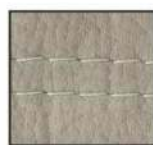
silber - F18