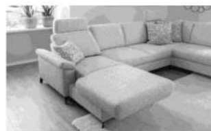
Sitzvorzug im Longchair AP52MOT