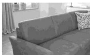
Rücken 1 inkl. Kopfstützentaschen