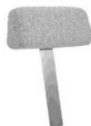
Typ -06 Kopfstütze lose Metallschwert fest gerade