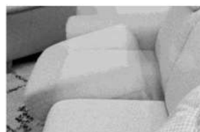
"Premiun Sofaassistent" APAH08K