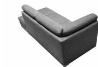
Ansicht der Eckteile mit Rücken 1 + 2 Typ -05, -41, -42