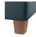
H 17 -10 H 17 -15 Holzfuß natur lackiert