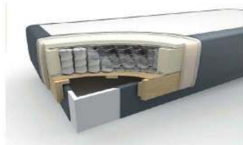
Taschenfederkern mit Bettkasten / gegen Aufpreis