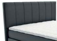
0451 Höhe 99 cm 0452 Höhe 109 cm 0453 Höhe 119 cm