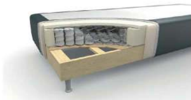
Taschenfederkern / Standard