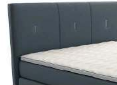
0454 Höhe 99 cm 0455 Höhe 109 cm 0456 Höhe 119 cm