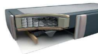
Taschenfederkern mit Motor / gegen Aufpreis