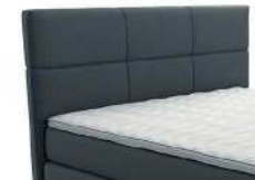
0457 Höhe 99 cm 0458 Höhe 109 cm 0459 Höhe 119 cm

3 HÖHEN alle Kopfteile sind in 3 verschiedenen Höhen erhältlich: 99 / 109 / 119 cm