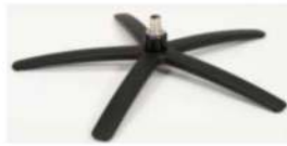
SBS Sirius Base - Schwarz