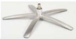
SB Sirius Base - Silver

Für alle Fußvarianten EB/EBS und SB/SBS Gaslift-Höhenverstellungs- Option möglich.