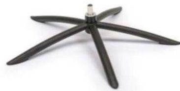
TSS2 Tube Space Metall Schwarz (Gaslift-Höhenverstellungs-Option nicht möglich)