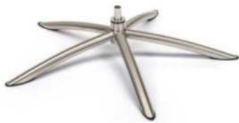
TS Tube Space Metall gebürstet (Gaslift-Höhenverstellungs-Option nicht möglich)