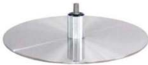
DBB Diskfuß - Metall gebürstet (Gaslift-Höhenverstellungs-Option nicht möglich)