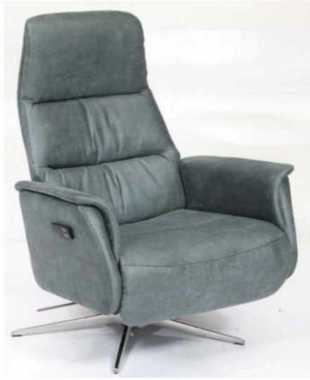
Schwarz Control-Panel 3-Motor-Sessel:

360° drehbarer 3-motorischer Relax-Sessel mit motorisch verstellbarer Rückenlehne, Fußstütze und Nackenstütze.