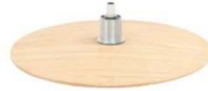
DBS Diskfuß Schwarz DBEO Diskfuß Eiche Geölt DBR3 Diskfuß Nuß Geölt DBEW Diskfuß Eiche weiß geölt DBE Diskfuß Eiche unbehandelt DBV3 Diskfuß Eiche geölt dunkel geräuchert DBU Diskfuß Buche unbehandelt DBEL Diskfuß Eiche Lackiert DBBL Diskfuß Buche Lackiert DBWN Diskfuß Buche, Nuß- gebeizt (Gaslift-Höhenverstellungs-Option nicht möglich)