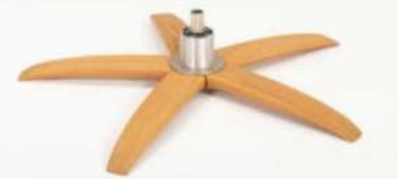
WSK Holzstern Fuß Schwarz WSG Holzstern Fuß Eiche Geölt WSR3 Holzstern Fuß Nuß Geölt WSM Holzstern Fuß Eiche weiß geölt WSH Holzstern Fuß Eiche unbehandelt WSV3 Holzstern Fuß Eiche geölt dunkel geräuchert WSD Holzstern Fuß Buche unbehandelt WSF Holzstern Fuß Eiche Lackiert WSC Holzstern Fuß Buche Lackiert WSW Holzstern Fuß Buche, Nuß- gebeizt

Für alle Fußvarianten WS Gaslift-Höhenverstellungs-Option nicht möglich.