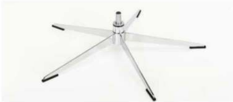
OS Orion Base - Chrom Für alle Fußvarianten Orion OS Gaslift-Höhenverstellungs-Option möglich