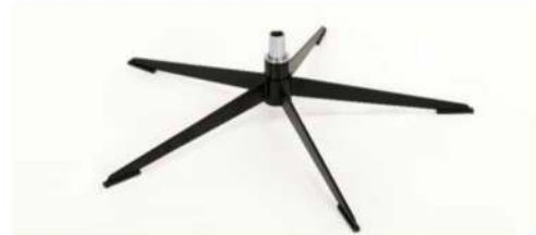
OSS Orion Base - Schwarz matt Für alle Fußvarianten Orion OSS Gaslift-Höhenverstellungs-Option möglich