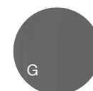
Glas grau getönt

OPTION 1 : Obere Platte aus Keramik, untere Platte aus Glas