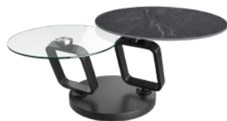
OZONE BLACK CT546MM

OPTION 2 : Doppelte Keramik- oder Glasplatte