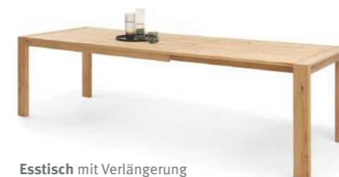
Esstisch mit Verlängerung

Die LED-Griffbeleuchtung setzt einen zusätzlichen Akzent und leitet die Hand zuverlässig zur Aluminium-Griffleiste.