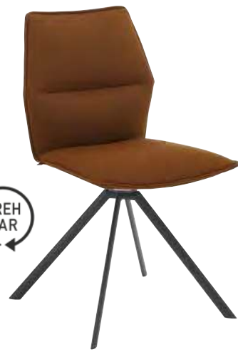
STUHL CAROLA: BHT 49/85/55 cm