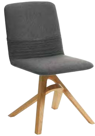
STUHL EMILIE: BHT 49/87/58 cm